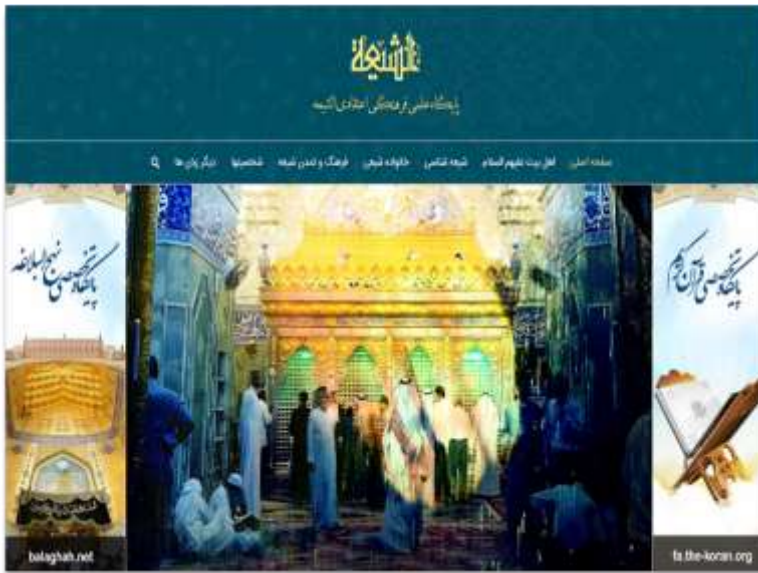
تصویر ۲: پایگاه اطلاع رسانی الشیعه