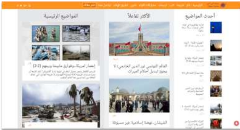
تصویر ۳: وبگاه IslamOnline