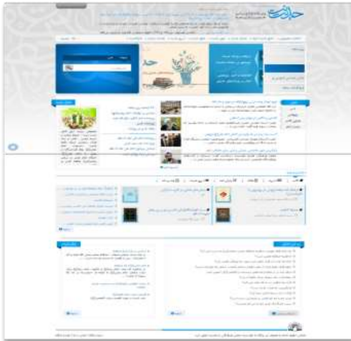
تصویر ۱: پایگاه اطلاع رسانی حدیث شیعه